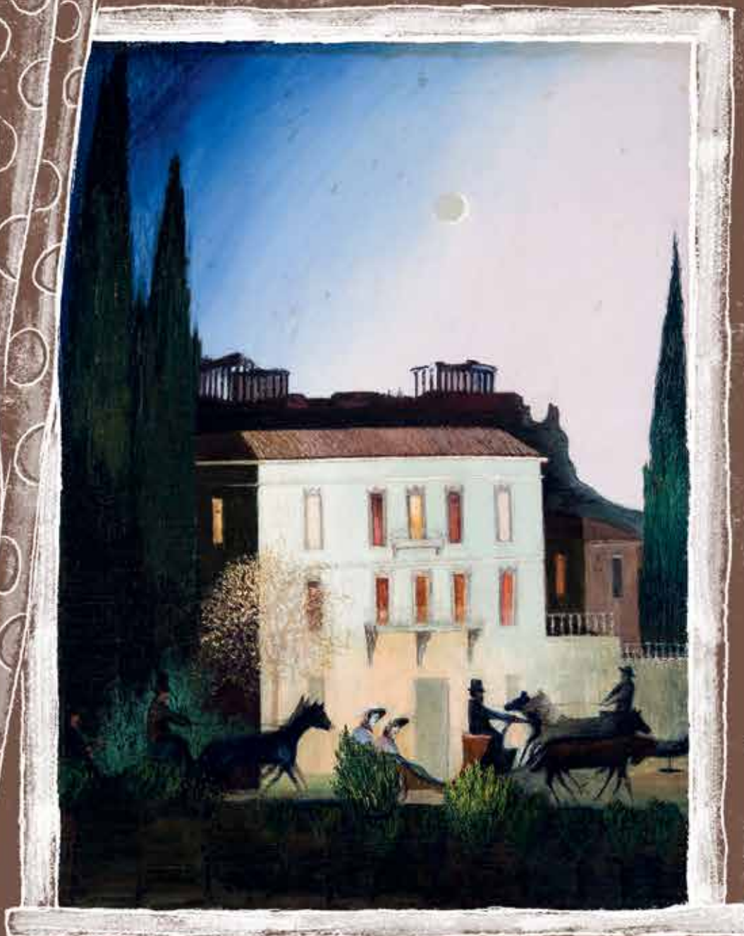
Csontváry Kosztka Tivadar Sétakocsizás Újholdnál Athénban